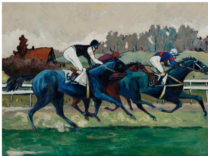
8) Henry Althaus, im Flachrennen, 2023, Öl auf Leinwand, 60 x 80 cm Henry Althaus, im Flachrennen, 2023, Huile sur toile, 60 x 80 cm