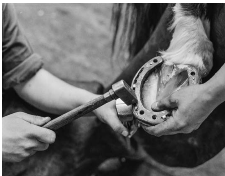
5) Christof Sonderegger, Eidgenössische Militär-Pferdeanstalt (EMPFA), 1975 Christof Sonderegger, Le dépôt fédéral des chevaux de l'armée (DFCA), 1975

Le troisième volet a pour but d'informer sur les métiers traditionnels encore pratiqués aujourd'hui pour entretenir les chevaux. Les objets exposés illustrent les métiers de sellier, de maréchal-ferrant et de charron. On y aborde également le domaine de la médecine vétérinaire, important pour l'entretien des chevaux.